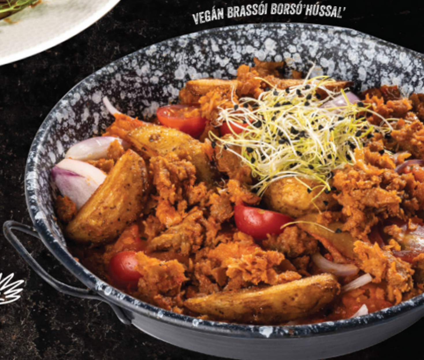
VEGÁN BRASSÓI BORSÓ'HÚSSAL'