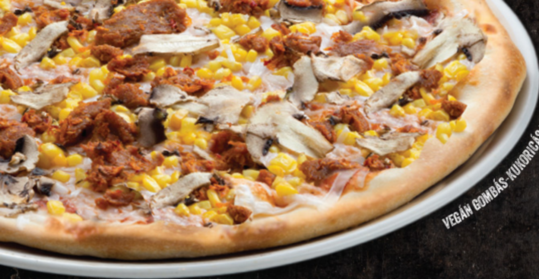
VEGÁN GOMBÁS-KUKORICÁS PIZZA