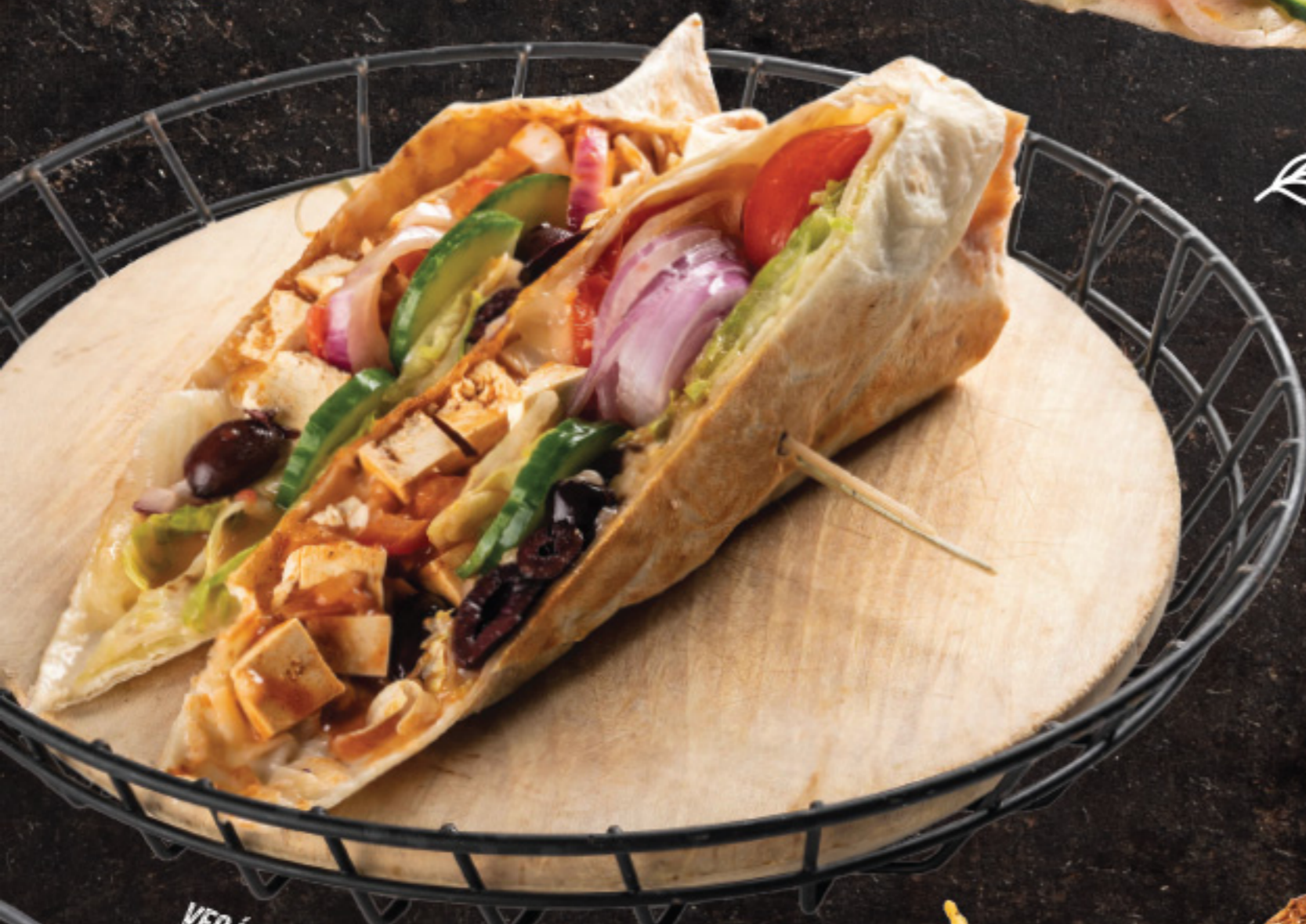
VEGÁN GYROS TORTILLA ROLLER