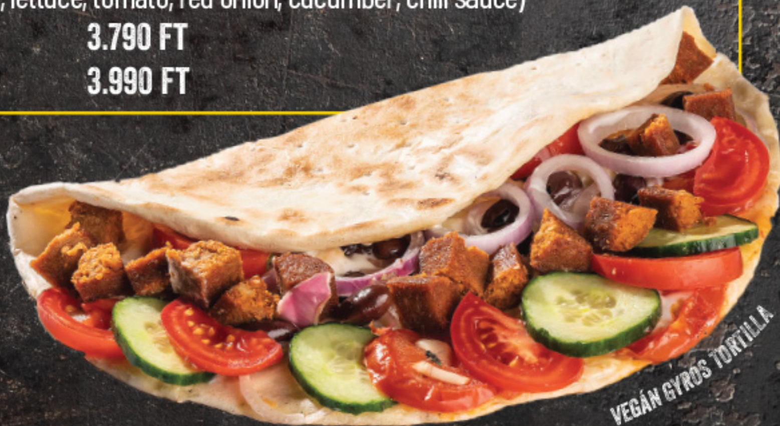
VEGÁN GYROS TORTILLA