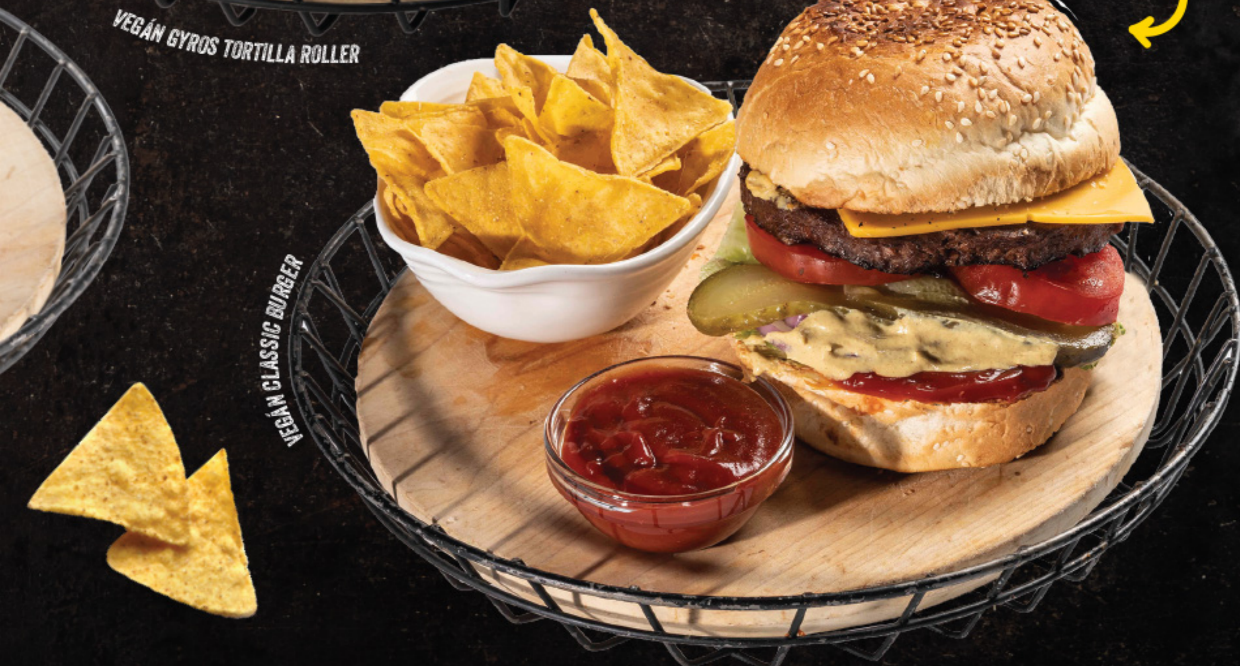
VEGÁN CLASSIC BURGER