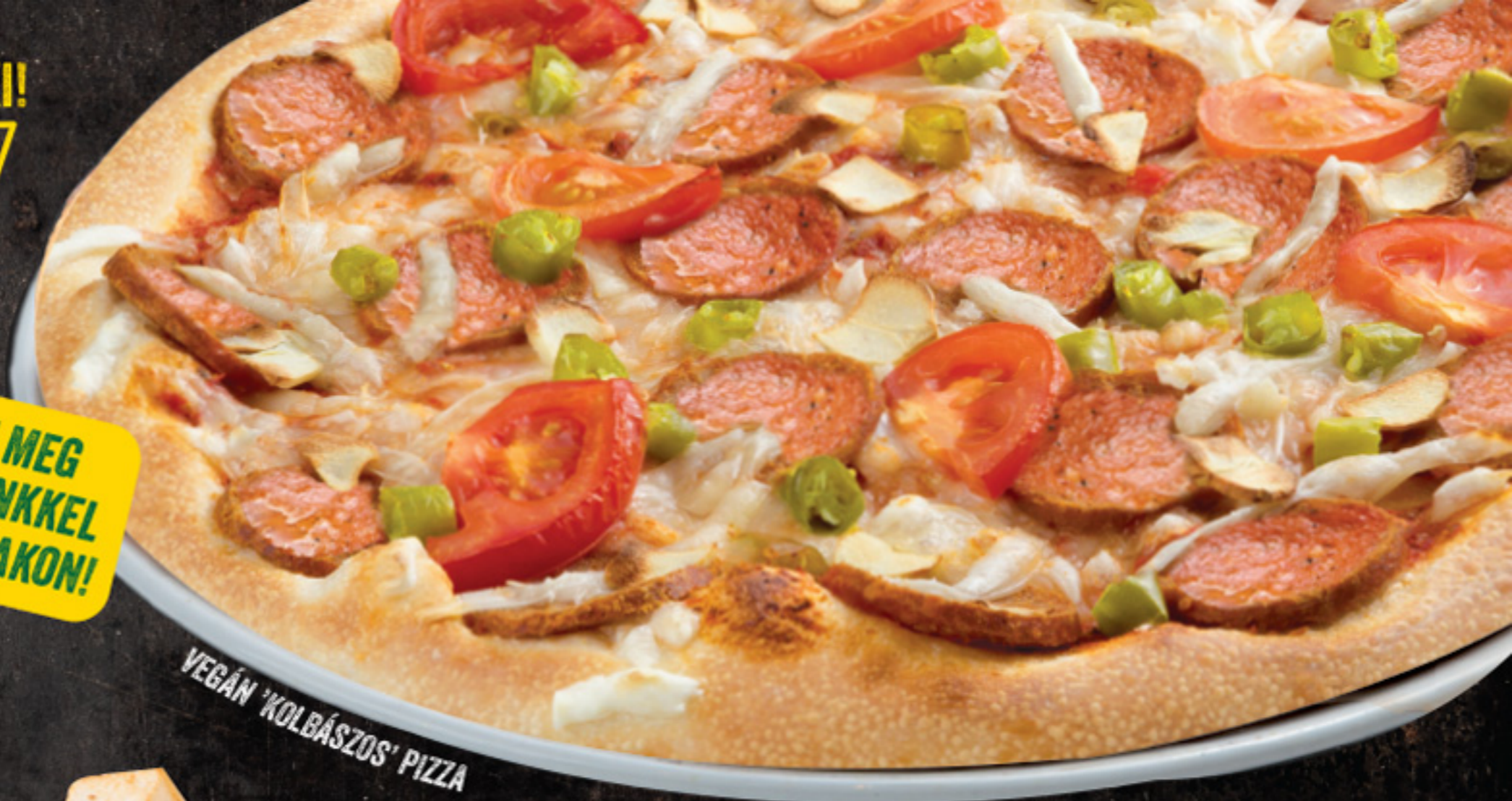
VEGÁN 'KOLBÁSZOS' PIZZA