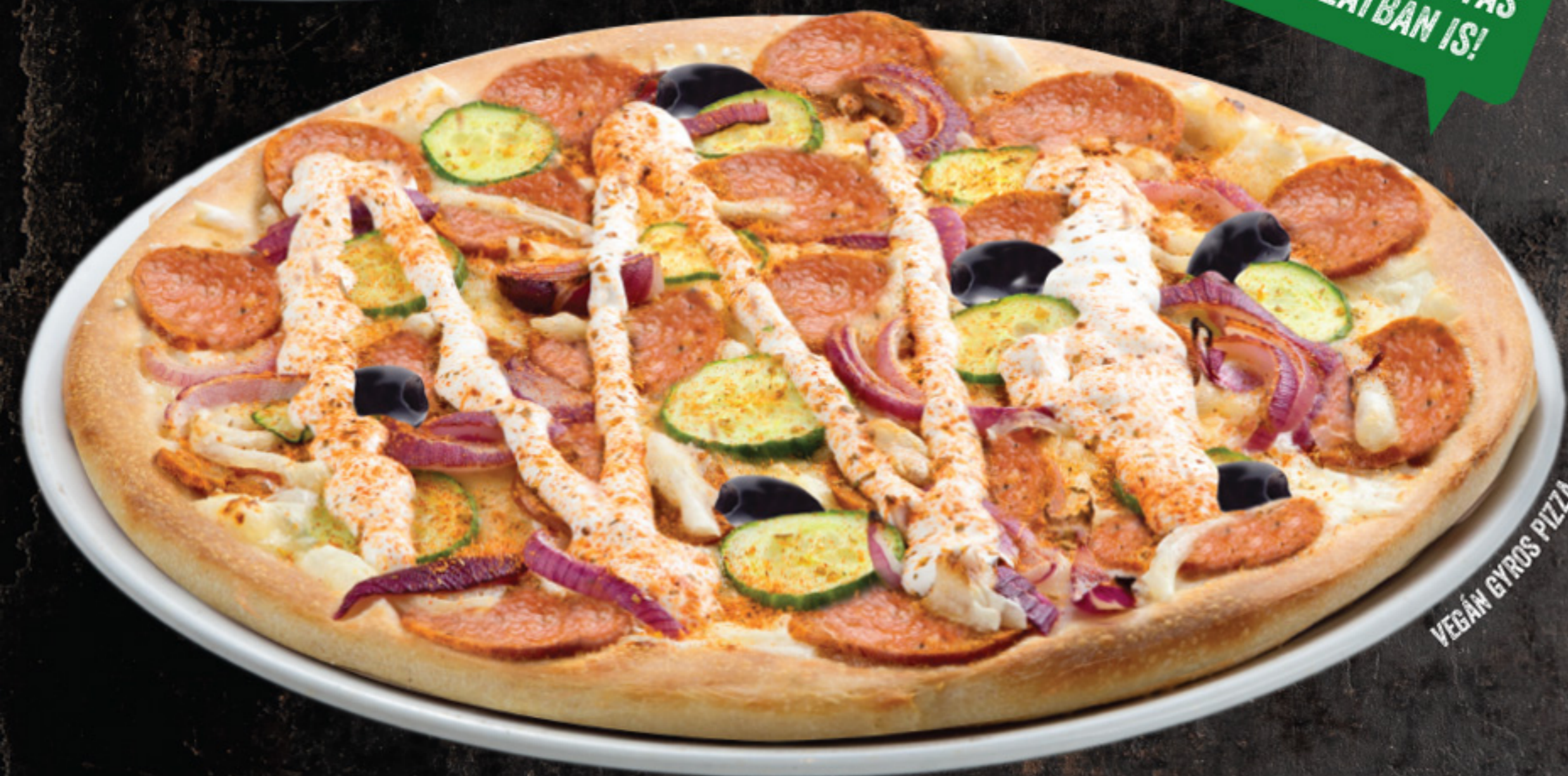
VEGÁN GYROS PIZZA

NORMÁL VASTAGSÁGÚ ÉS VÉKONY TÉSztÁS VÁLTOZATBAN IS!