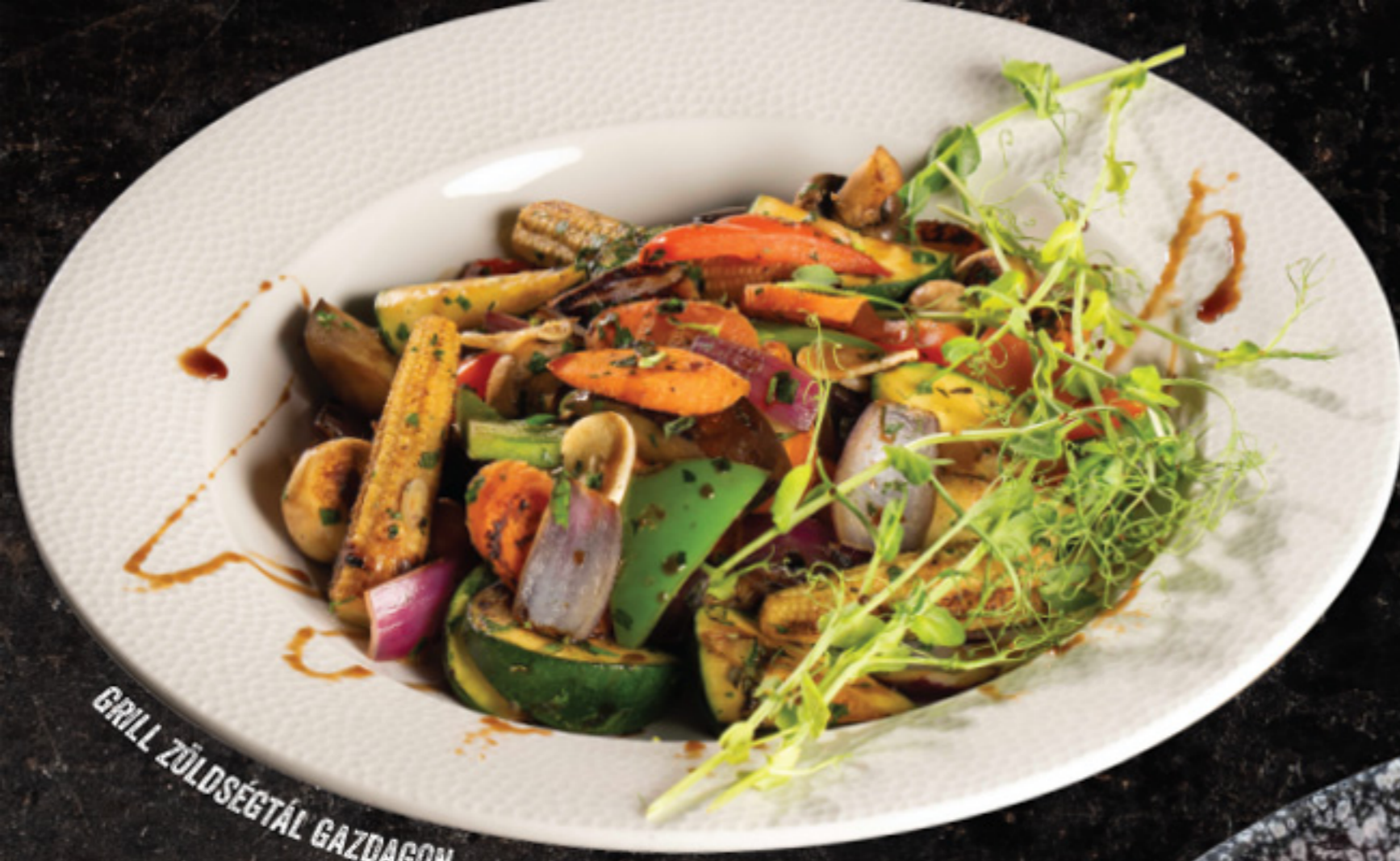
GRILL ZÖLDSÉGTÁL GAZDAGON